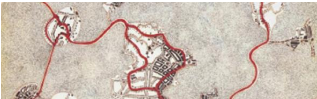
Carte des lieux vrais, dans l'imagination de l'artiste Michael le Cartographe, Angleterre années 1990