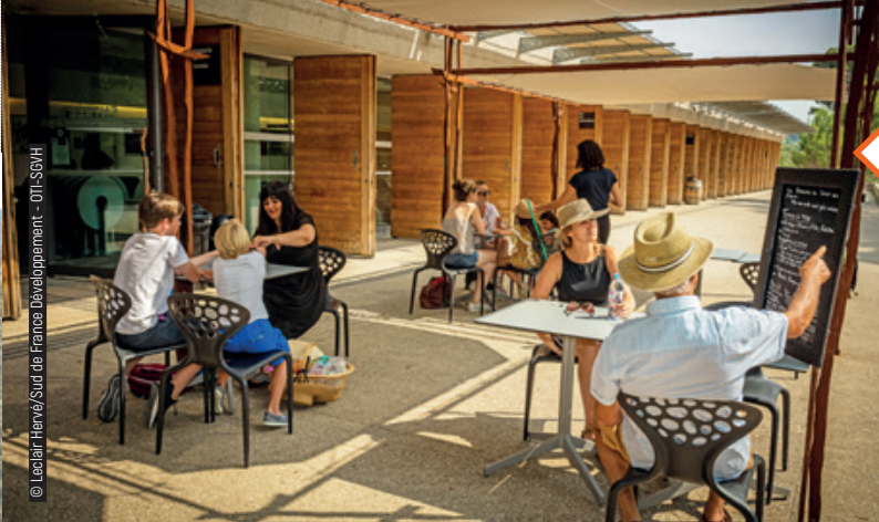
Parvis de la Maison du Grand Site de France à Aniane.