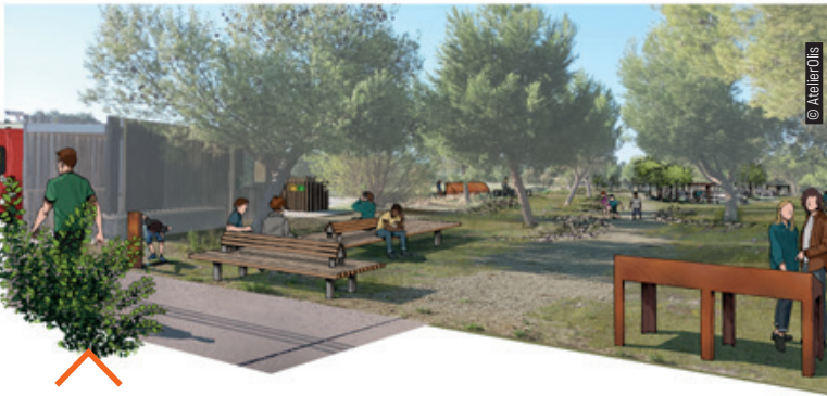
Des nouveaux équipements et une revégétalisation de l'esplanade pour un espace dédié aux mobilités douces sur le site du pont du Diable.