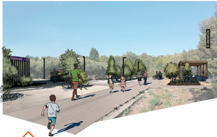
Une ombrière prendra place à proximité du parking revégétalisé et fluidifié.

La gestion des déchets va également être améliorée pour faciliter le geste de tri à tous les visiteurs et limiter la pollution sur ce site remarquable.